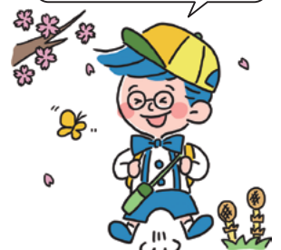
和敬会マスコットキャラクター ワケちゃん